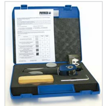
Transportkoffer mit Zubehör

Gitterschnitt-Prüfgerät, Mehrschneidmesser, Transportkoffer, Innensechskant-Schlüssel, Vergrößerungsglas, Bürste, Bedienungsanleitung