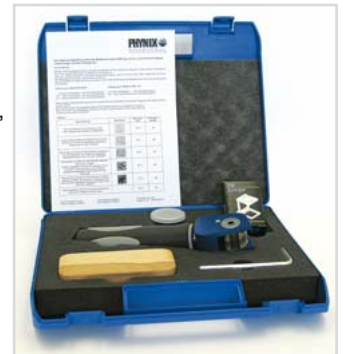
Carrying case with accessories

Cross Hatch Cutter, cutting blade with multiple blade, sturdy carrying case, hex key, magnifying glass, brush, operating manual